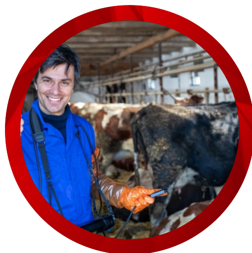
Pecuária (Inseminação Artificial e Criação de Matrizes)