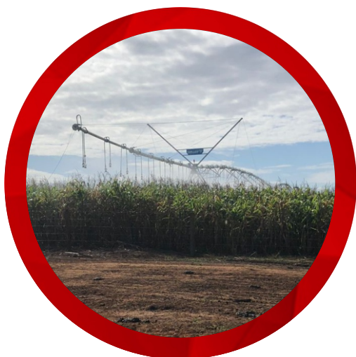
Irrigação por Pivô Central

Na Fazenda Canto do Maravilha são desenvolvidas as seguintes atividades: