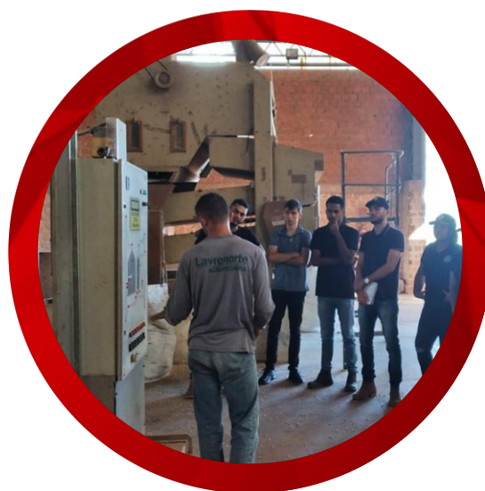
Armazenamento de sementes (câmara fria)