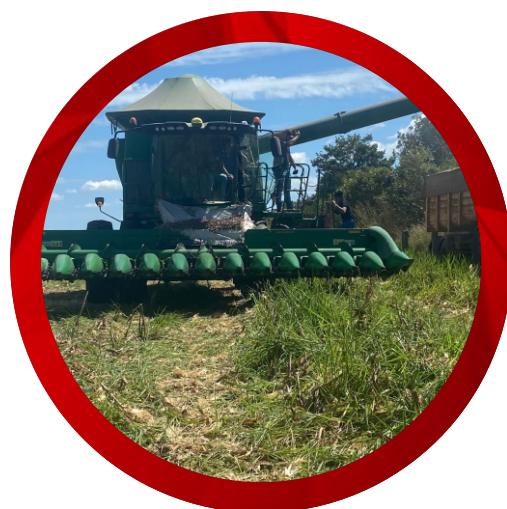
Manutenção de máquinas e equipamentos