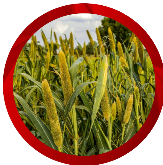
Cultivo de milho e braquiária (safra secundária)