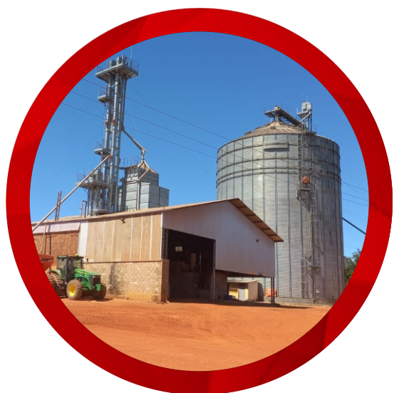
Armazenamento e secagem de grãos