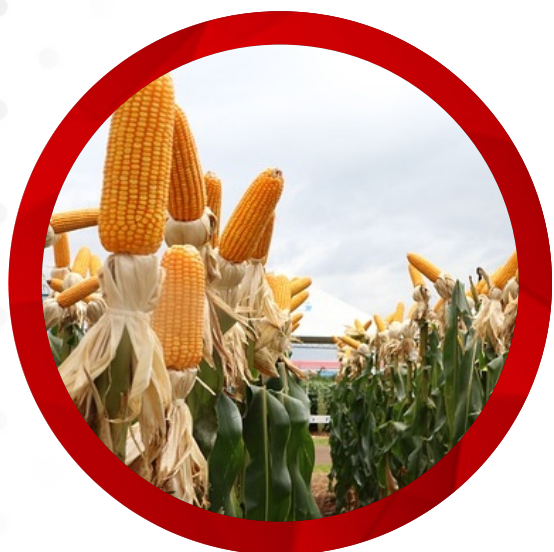
Cultivo de soja e milho (safra principal)

Na Fazenda Canto do Maravilha são desenvolvidas as seguintes atividades: